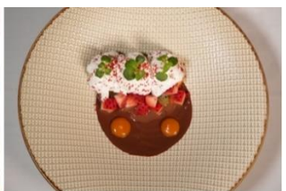
Atmosphäre Kanifushi